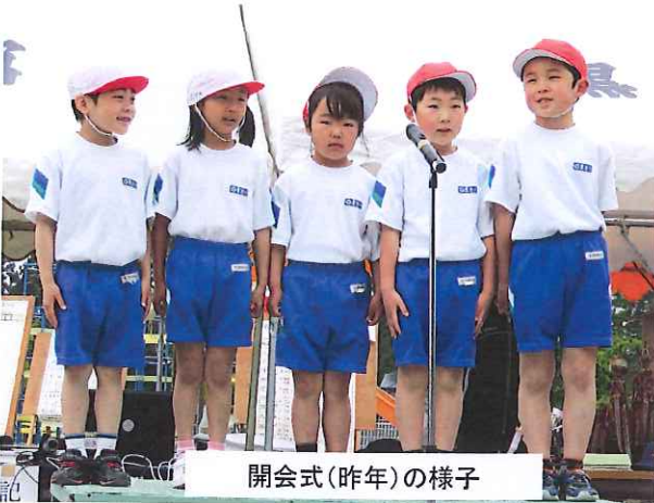
開会式(昨年)の様子