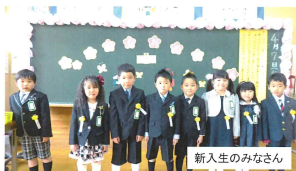
新入生のみなさん