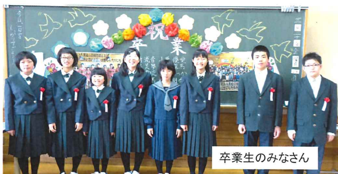
卒業生のみなさん

また、4月7日(火)は平成27年度黒岩小学校の入学式が行われ、可愛らしい新1年生8名が大きなランドセルを背にドキドキ・わくわくいっぱい小学校生活をスタートさせました。