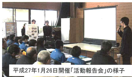
平成27年1月26日開催「活動報告会」の様子

3月14日(土)、東京都で行われた第9回エネルギー教育賞の高校・高専の部で、黒沢尻工業高校が地域の小中学校で理科を教える出前講座や、当黒岩地区と連携してスマートコミュニティーの構築を目指す「黒工×黒岩プロジェクト」などの活動を高く評価され、最優秀賞に輝きました。