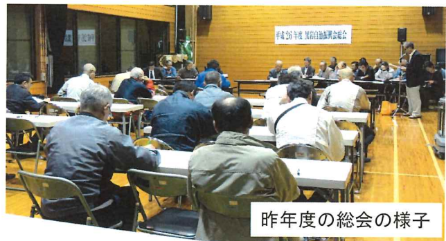
昨年度の総会の様子