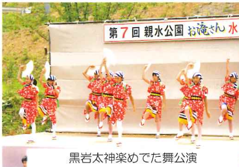
黒岩太神楽めでた舞公演

当日は台風の心配もよそに大勢の来場者があじさいの咲き誇る親水公園お滝さんに集まり、芸能公演やクイズにマジックショー、そばや餅の振る舞いに大満足の表情を見せていました。