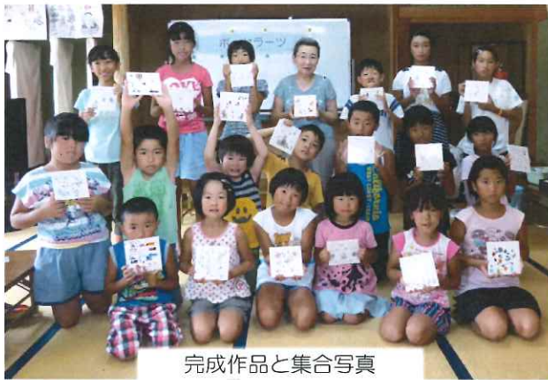
完成作品と集合写真