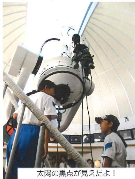
太陽の黒点が見えたよ！