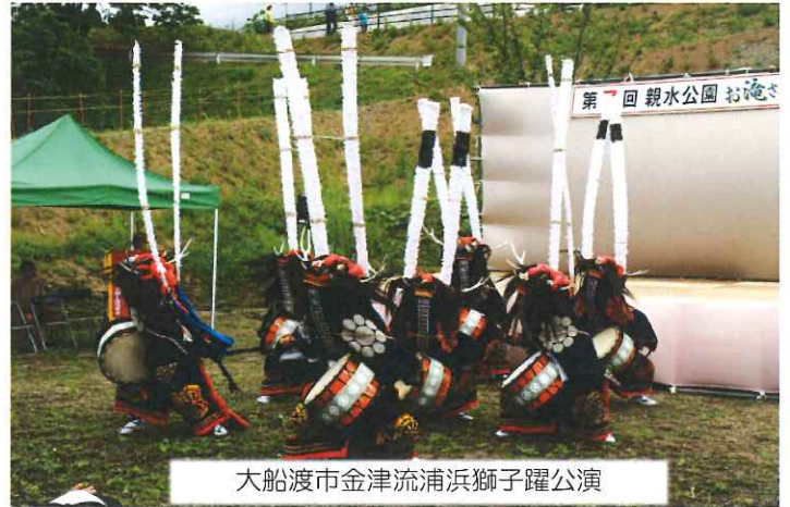
大船渡市金津流浦浜獅子躍公演

当日は台風の心配もよそに大勢の来場者があじさいの咲き誇る親水公園お滝さんに集まり、芸能公演やクイズにマジックショー、そばや餅の振る舞いに大満足の表情を見せていました。