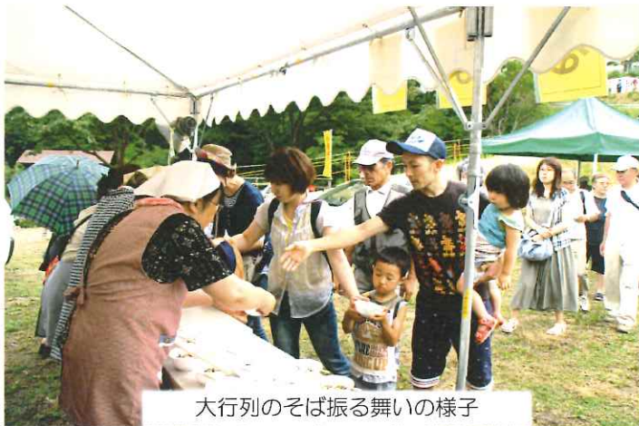
大行列のそば振る舞いの様子

親水公園お滝さん水車まつり実行委員会は去る7月19日(日)に、「第7回水車まつり」を開催しました。