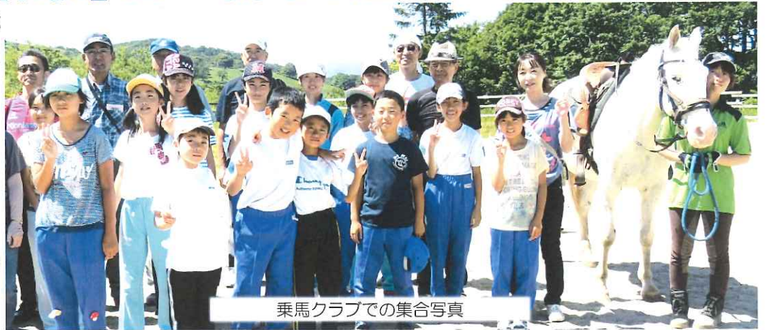
乗馬クラブでの集合写真

1日目は室根高原にある「風薫る丘みちのく乗馬クラブ」で乗馬体験を行いました。自分達より大きな馬に一人ずつ乗り大自然を眺める子供たちの表情はとても活気に満ちていました。