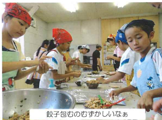
餃子包むのむずかしいなあ

夕食は「黒岩豚太くん」を使用して手作り餃子に挑戦。いつもは火の番の男子も苦労しながらいろいろな形の美味しい餃子ができました。150個作った餃子もあっという間になくなりました。