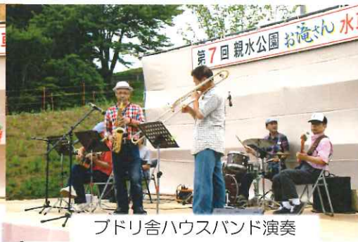
ブドリ舎ハウスバンド演奏