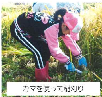
カマを使って稲刈り

刈り取った稲は6株ごとに1つに束ね、低学年が稲の束を運び、高学年が馳せ掛けを行いました。最後に刈り終わった田んぼに落ちている稲穂をたくさん拾い終了。春の田植えから稲刈りまで米の出来るまでを学びました。