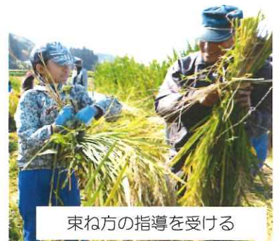
束ね方の指導を受ける

収穫したお米は来年1月に行う世代間交流会で試食する予定です。指導いただいた講師の皆さん、お手伝いいただいた地域の皆さんありがとうございました。