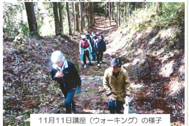
11月11日講座(ウォーキング)の様子