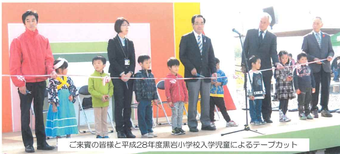
ご来賓の皆様と平成28年度黒岩小学校入学児童によるテープカット

10月18日(日)秋晴の中、第17回湧湧ランドくろいわ芸・農・まつりが黒岩まんなか広場で開催されました。毎年恒例の来年度黒岩小学校入学児童8名と来賓の方によるテープカットでまつりのスタートとなりました。ステージ公演では、宿館神楽でまつりの成功を祈願し、近隣2地区より「立花念仏剣舞」、「口内明神太鼓」、東陵中学校吹奏楽部の皆さんなど地区外からもたくさんの方にまつりを盛り上げていただきました。