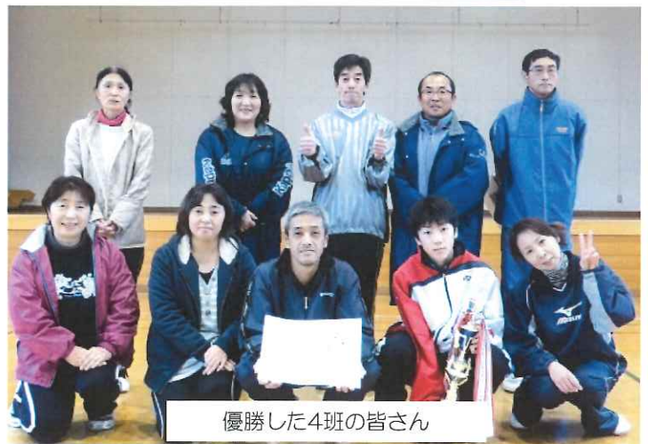
優勝した4班の皆さん