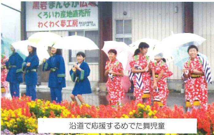
沿道で応援するめでた舞児童

黒岩地区内は午前中に選手が通過し、あいにくの天気でしたが沿道にはたくさんの応援にご協力いただきありがとうございました。第4給水所(黒岩郵便局前)では東陵中学生がボランティアとして参加し、頑張ってくれました。2団体が沿道での応援公演の予定でしたが雨の為、めでた舞児童は衣装を着ての応援となり、雨が止んでから黒岩鬼剣舞の公演となりました。