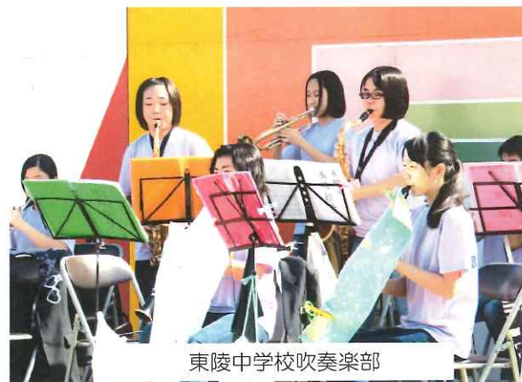
東陵中学校吹奏楽部

今年も(株)ケー・アイ・ケー様から多くのボランティアスタッフ協力のおかげでまつりを運営することができました。ありがとうございました。