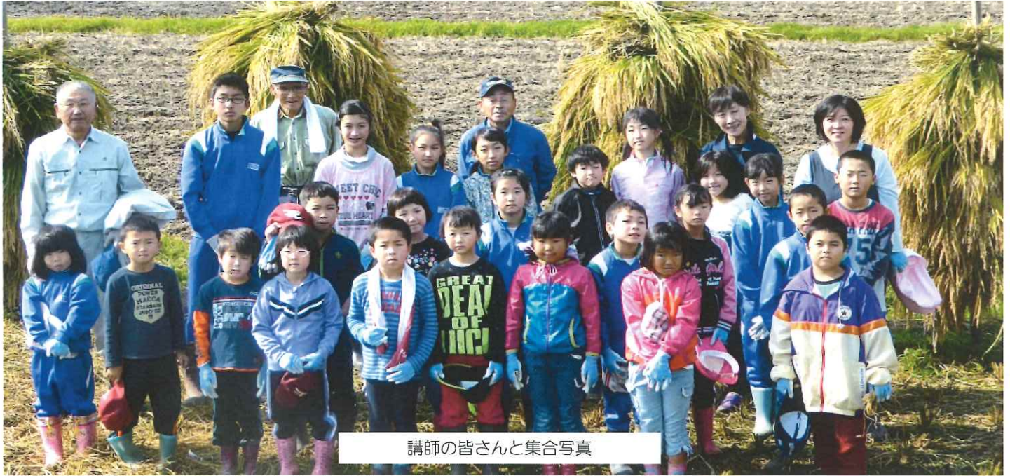
講師の皆さんと集合写真

今回のお仕事体験は5月に植えた苗が大きく実り稲刈り体験に挑戦しました。ほとんどの児童が稲刈りが初めてで鎌を使っての刈り方や稲の束ね方など講師の話をよく聞き作業を進めましたが、なかなか思うように進まず奮闘していました。交代で鎌を持ち1株ずつ丁寧に刈り取りました。