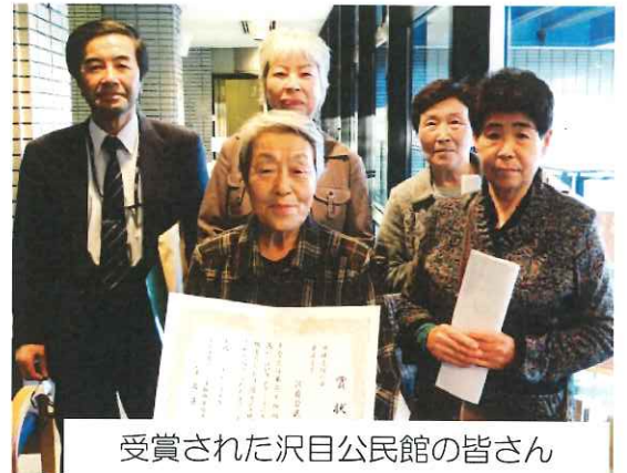
受賞された沢目公民館の皆さん