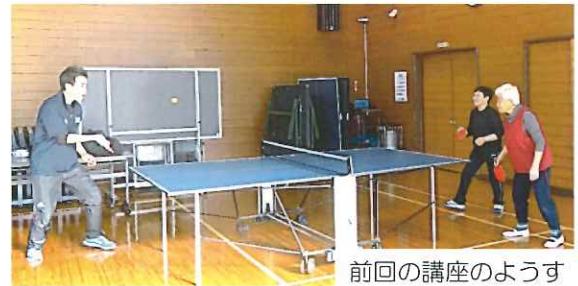
前回の講座の様子