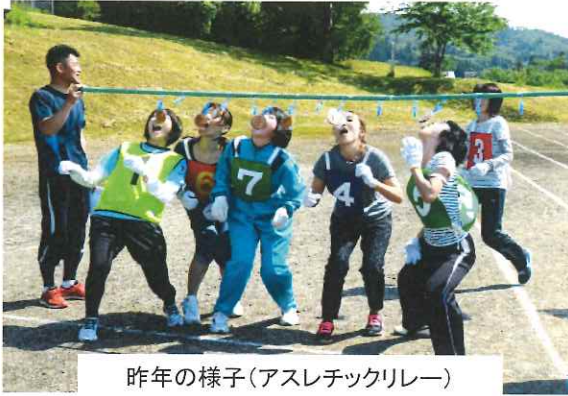
昨年の様子(アスレチックリレー)

平成27年度は下表のとおり4競技により総合優勝が決まり、運動会の得点がカギを握ります。各班力を合わせて頑張ってください。午前中のかわいい小学生の活躍にも大きな声援をお願いします。尚、8時30分より行う入場行進も得点になりますのでお早目にご来場ください。