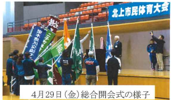
4月29日(金)総合開会式の様子

5月1日(日)に開催された北上市地区対抗駅伝競走大会に出場した方々を紹介しします。選手の皆さんお疲れ様でした。