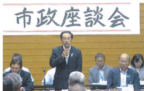
北上市長あいさつ

北上市では、黒岩を含む東部4地区の協議結果を踏まえ、課題を整理し、小中学校PTAとの協議を進め、今年度末に基本方針・計画案を示す方針です。