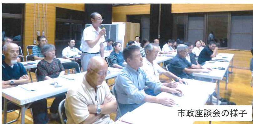
市政座談会の様子

昨年の協議を踏まえ、中学校を含めた統合の見直しについて、具体的な方向性、計画案を示すよう求めました。