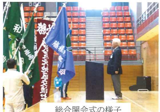
総合開会式の様子

4月30日(日)に北上市民体育大会開会式が総合体育館で開催されました。全21競技が開催されます。