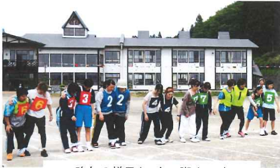
昨年の様子(二人三脚リレー)

平成28年度は下表のとおり4競技により総合優勝が決まりますので、運動会の得点がカギを握ります。各班とも力を合わせて頑張ってください。午前中のかわいい小学生の活躍にも、大きな声援をお願いします。尚、8時30分より行う入場行進も得点になりますのでお早目にご来場ください。