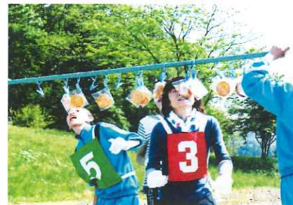
「アスレチックリレー」の様子

青空の下、第64回黒岩地区合同大運動会が5月20日(土)行われました。平成28年度の総合優勝をかけ、各競技で熱戦が繰り広げられ、グラウンド内は大きな声援に包まれました。運動会の部では2位に大差をつけ176点で2班が優勝しました。総合の部では35点で5班の優勝となりました。選手の皆さんお疲れ様でした。また、運営にご協力いただいた皆様ありがとうございました。