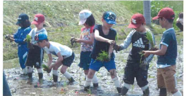
植えた苗を踏まないように慎重に進む子供たち

田植えが終わると、いよいよ「泥んこレース」です。2組に分かれ、浮き輪にボールを入れてリレーをしました。泥の中でもお構いなしに思いっきり走り、足を取られて転ぶ子供もいました。黒岩の田んぼに笑い声が響き楽しいひと時となりました。