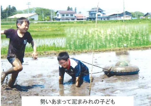
勢いあまって泥まみれの子ども

昼食は、昨年塾生が育てたお米を使用して黒岩産直加工部の方に炊き込みご飯にしてもらい美味しく食べることができました。