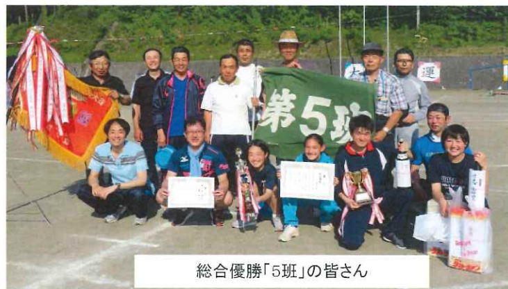
総合優勝「5班」の皆さん