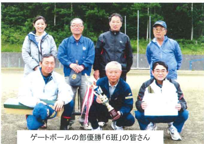
ゲートボールの部優勝「6班」の皆さん