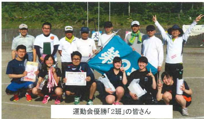
運動会優勝「2班」の皆さん