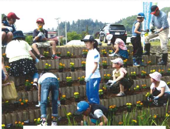
花苗を植える子供達

田植え体験の後、わい・わい塾生は黒岩ビオトープに行きマリーゴールドの花苗を300本植えました。これは黒岩地区農地・水・環境活動組織委員会の環境美化活動の一環として子供たちと共同で行う事業です。夏には黒岩ビオトープの花壇に、黄色やオレンジ色の花がいっぱいに広がることでしょう。