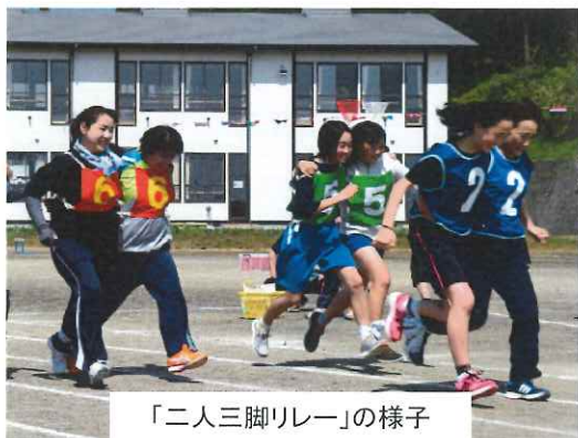
「二人三脚リレー」の様子