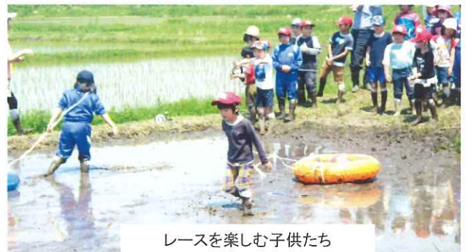
レースを楽しむ子供たち

田植えが終わると、いよいよ「泥んこレース」です。2組に分かれ、浮き輪にボールを入れてリレーをしました。泥の中でもお構いなしに思いっきり走り、足を取られて転ぶ子供もいました。黒岩の田んぼに笑い声が響き楽しいひと時となりました。