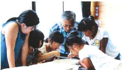
水生生物を観察する子供たち

採取した水生生物をセンターに持ち帰り、同じ種類の生き物を数え、カワナやサワガニなどが昨年よりも多くいたことから「ややきれいな水」だということが分かりました。