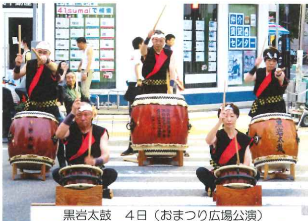
黒岩太鼓 4日（おまつり広場公演）

今年の「第56回北上・みちのく芸能まつり」は8月4・5・6日に開催されました。黒岩地区の各芸能団体も出演、日頃の練習の成果を発揮し、多くの観客を前に堂々と披露していました。会場は大きな声援に包まれていました。