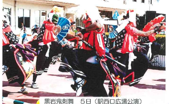
黒岩鬼剣舞 5日（駅西口広場公演）