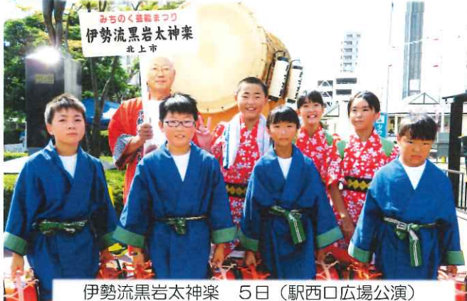
伊勢流黒岩太神楽 5日（駅西口広場公演）