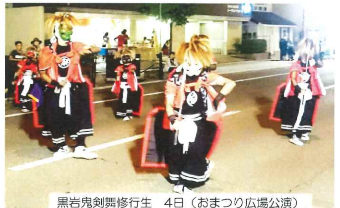
黒岩鬼剣舞修行生 4日（おまつり広場公演）