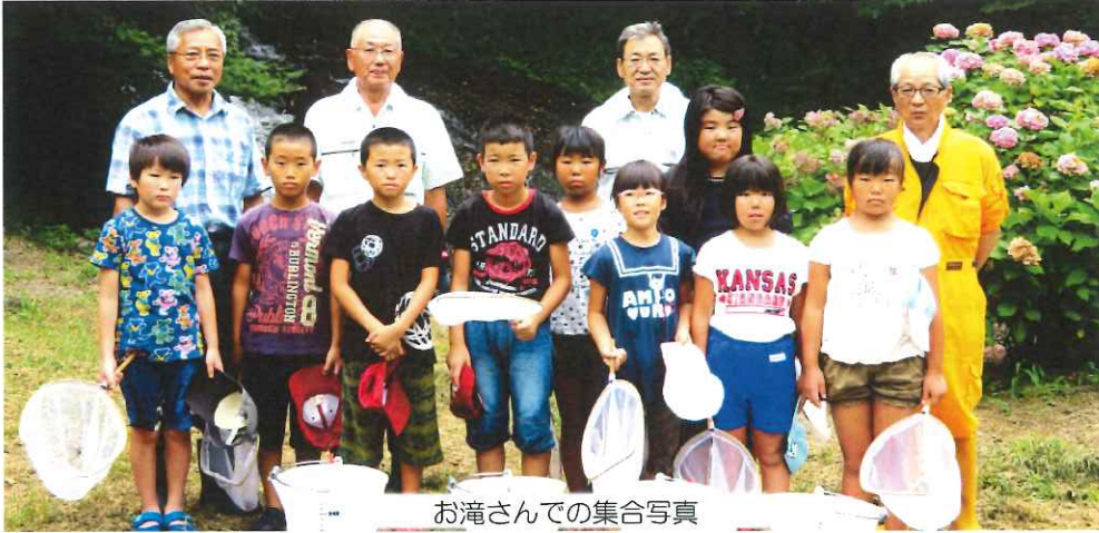
お滝さんでの集合写真