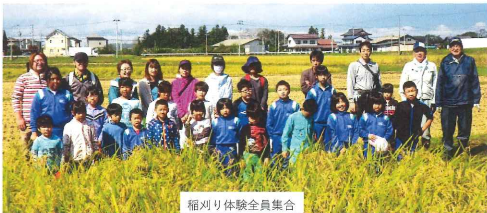
稲刈り体験全員集合

9月30日(土)、親子稲刈り体験を行いました。5月の田植え体験(岩崎地区内)に苗を植え、順調に生育した稲を手作業で刈り取り、脱穀する作業に挑戦しました。黒岩地区農地・水環境活動組織委員会の指導で稲をしっかりと握り、鎌で一気に刈り取ると子供たちは満足気な表情でした。