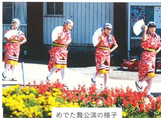
めでた舞公演の様子