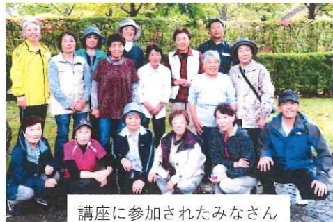
講座に参加されたみなさん