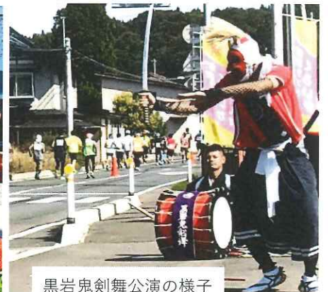
黒岩鬼剣舞公演の様子

黒岩まんなか広場周辺では黒岩太神楽(めでた舞)と黒岩鬼剣舞によります芸能公演で選手にエールを送ってくれました。ありがとうございました。