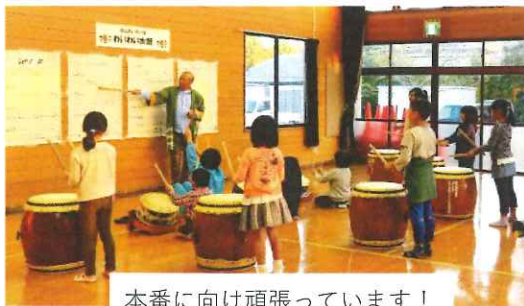
本番に向け頑張っています！

今年も10月15日の芸・農・まつり「お楽しみステージ」にて披露しますので、応援をお願いします。