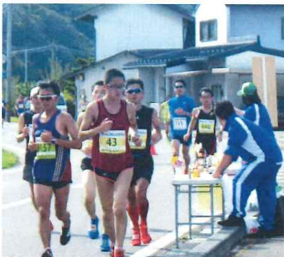
第4給水所（黒岩郵便局付近）の様子

昨年は国体開催の為中止となったマラソン大会でしたが、今年は10月8日(日)に行われ、約1,500名のランナーが黒岩地区を駆け抜けました。天気にも恵まれ18キロ地点にある黒岩郵便局前には第4給水所が設置され専修大学北上福祉教育専門学生10名と多くの地区民の方にもお手伝い頂きました。また、黒岩地区全域にかけて走路員のボランティアのご協力によりスムーズに終えることができました。