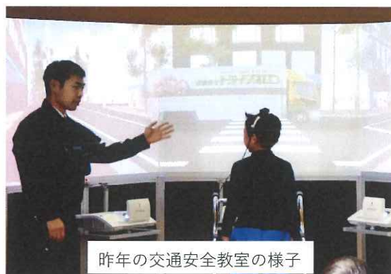
昨年の交通安全教室の様子

交安協黒岩分会では岩手県警察本部より講師をお招きし、最新歩行環境シミュレータ『わたりジョーズ君』を使用して交通安全教室を行います。皆様のお越しをお待ちしております。