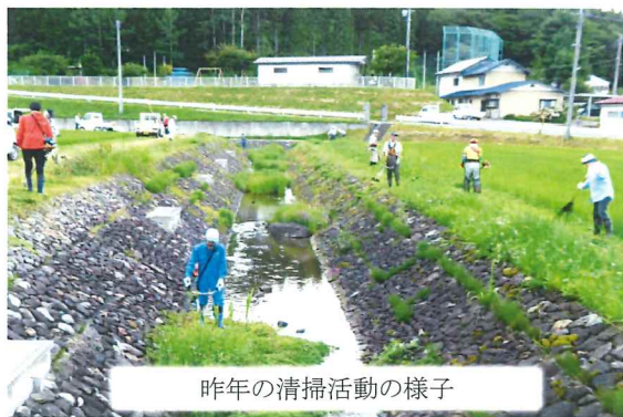
昨年の清掃活動の様子