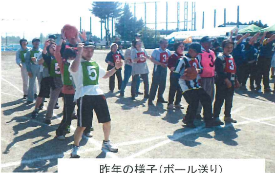
昨年の様子(ボール送り)

平成29年度は下表のとおり3競技がすでに終了し大運動会により総合優勝が決まります。各班とも力を合わせて頑張ってください。午前中のかわいい小学生の活躍にも、大きな声援をお願いします。尚、8時30分より行う各班の入場行進も得点になりますのでお早目にご来場ください。