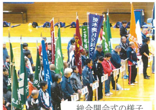
総合開会式の様子

4月29日(日)に北上市民体育大会開会式が総合体育館で開催されました。全21競技が開催されます。