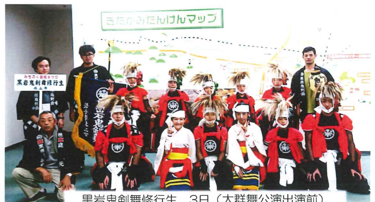
黒岩鬼剣舞修行生 3日(大群舞公演出演前)