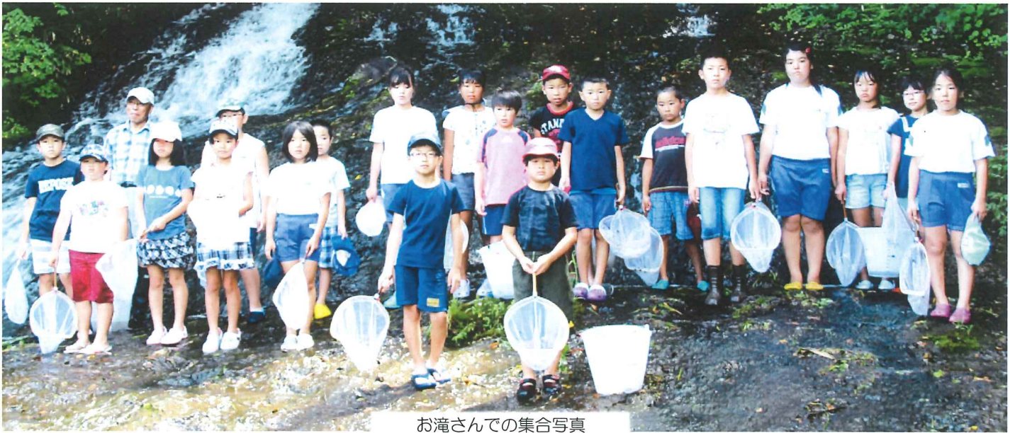
お滝さんでの集合写真