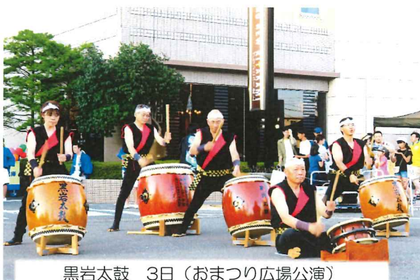
黒岩太鼓 3日(おまつり広場公演)

今年の「第57回北上・みちのく芸能まつり」は8月3・4・5日に開催されました。雨の為一部中止となった公演もありましたが黒岩地区の各芸能団体も出演し、日頃の練習の成果を発揮して、多くの観客を前に堂々と披露していました。