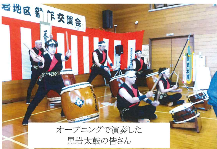
オープニングで演奏した黒岩太鼓の皆さん