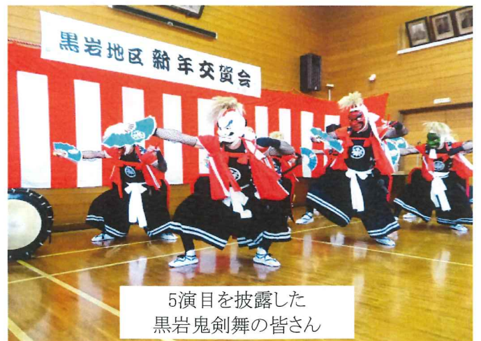
5演目を披露した黒岩鬼剣舞の皆さん