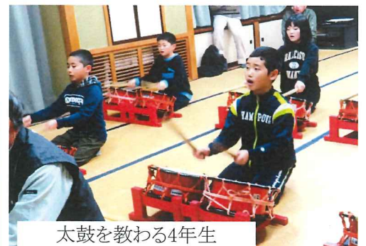
太鼓を教わる4年生