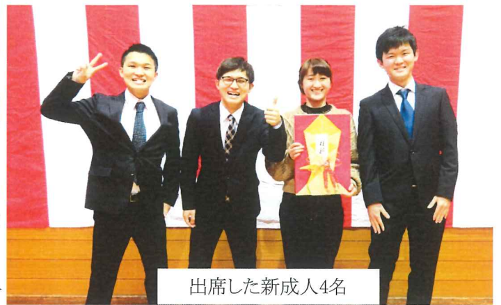
出席した新成人4名