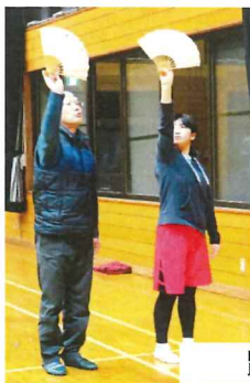
踊りを教わる5年生

黒岩小学校の4・5年生は1月5日から12日までの8日間、地域の民俗芸能「めでた舞」の練習を頑張っています。黒岩太神楽保存会の方々に扇子の回し方などひとつひとつ丁寧に指導を受け最終日の笠揃えに向けて奮闘中です。笠揃え(12日)では衣装を身につけ家族の方に披露する予定です。