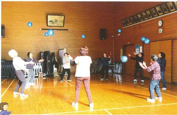
1月9日(水)運動講座の様子