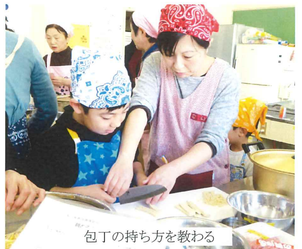
包丁の持ち方を教わる