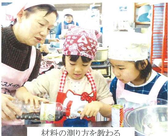
材料の測り方を教わる

料理をする前の身支度の方法や、包丁の持ち方、材料の測り方などを丁寧に教えてもらい、楽しく、おいしく作ることが出来ました。出来上がった料理を皆で試食し「おいしいね」と笑顔があふれていました。お家でも一緒に作ってみてね。