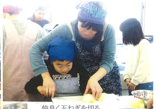
仲良く玉ねぎを切る