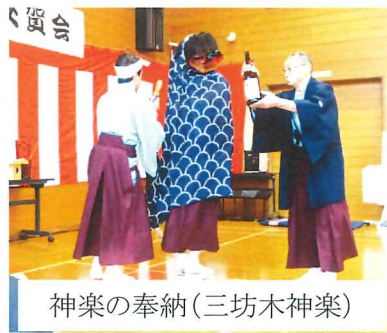
神楽の奉納(三坊木神楽)