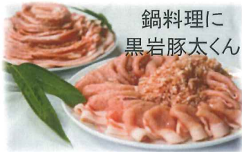
鍋料理に 黒岩豚太くん