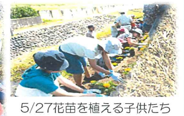
5/27花苗を植える子供たち