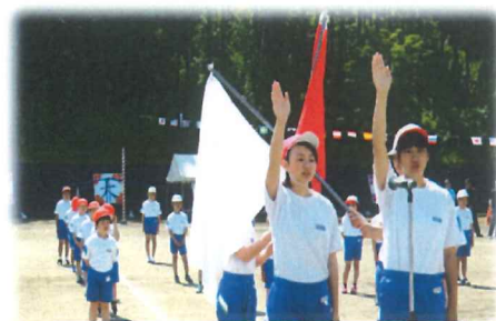
選手宣誓する6年生児童

今年の大運動会は、天候にも恵まれ今までにない暑い中での開催となりました。平成30年度の総合優勝をかけ各競技で熱戦が繰り広げられ、グラウンド内は大きな声援に包まれました。運動会の部、総合の部2位に大差をつけ5班が優勝しました。選手の皆さん、応援していた皆さんお疲れさまでした。また運営にご協力いただいた皆様ありがとうございました。