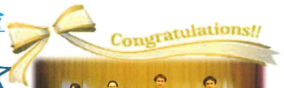
優勝した5班のみなさん