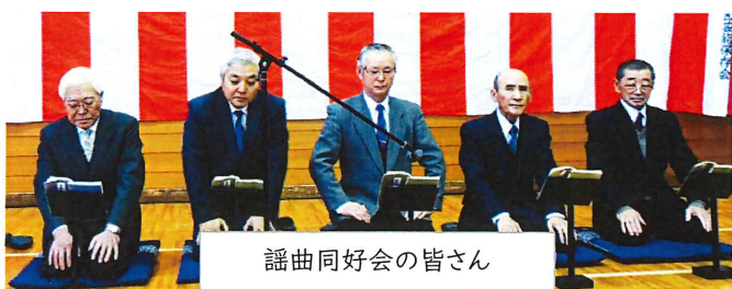
謡曲同好会の皆さん

1月3日(金)交流センター多目的ホールで70名を超える方々にご参加頂き、黒岩地区新年交賀会が盛大に開催されました。