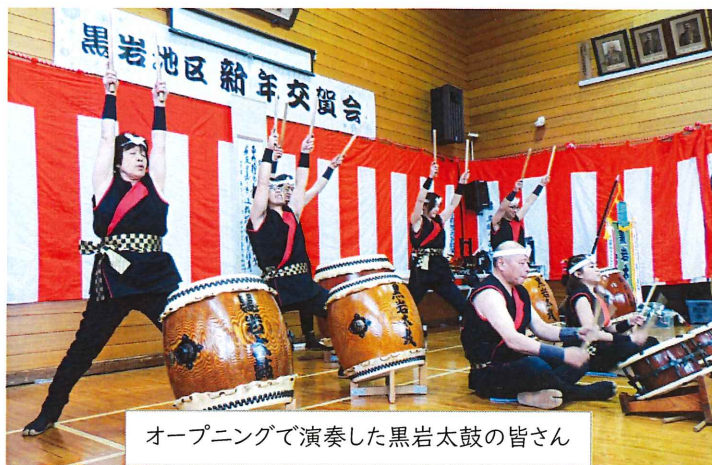
オープニングで演奏した黒岩太鼓の皆さん