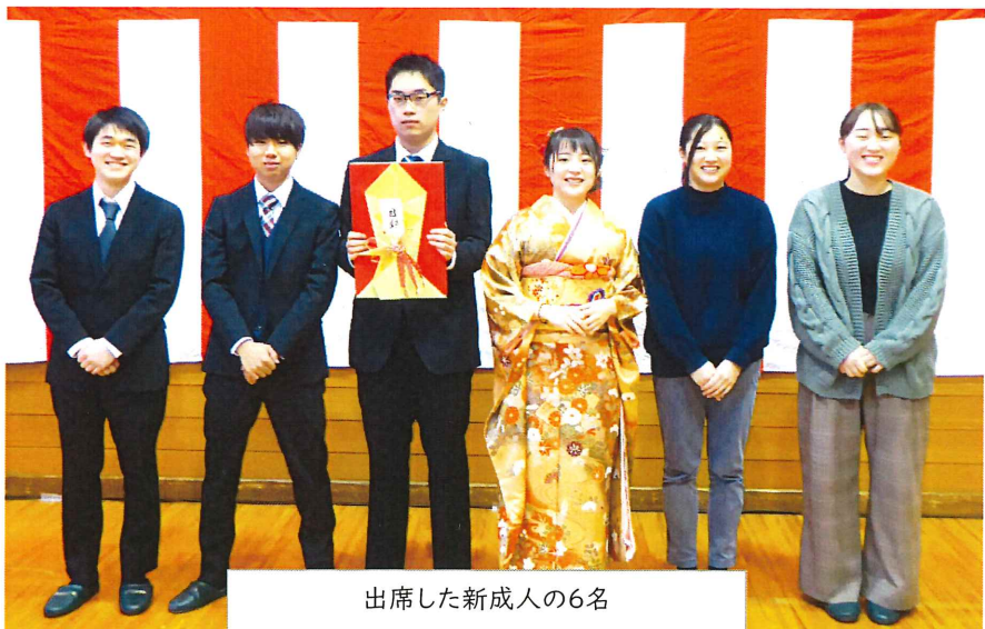
出席した新成人の6名