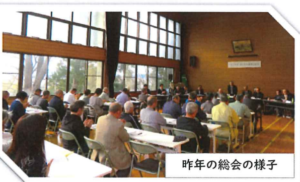
昨年の総会の様子

令和2年度の総会を下記のとおり行います。よりよい地域づくりを目指すため、皆様の出席をお願いします。なお、案内文書、総会資料の配布日はご覧のとおりです。