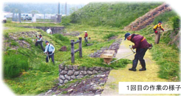
1回目の作業の様子