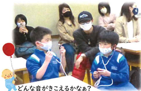
どんな音がきこえるかなあ?