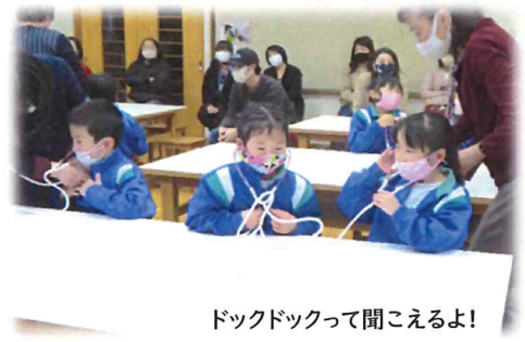
ドクドクって聞こえるよ!