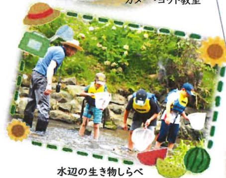
水辺の生き物しらべ