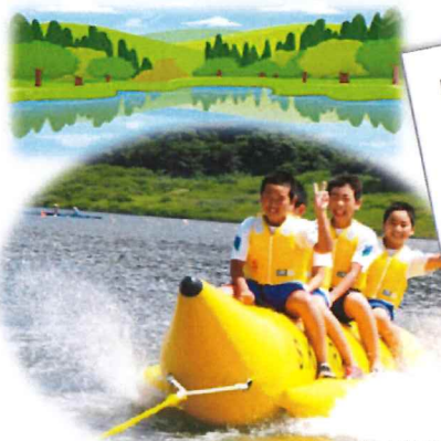
カヌー・ヨット教室