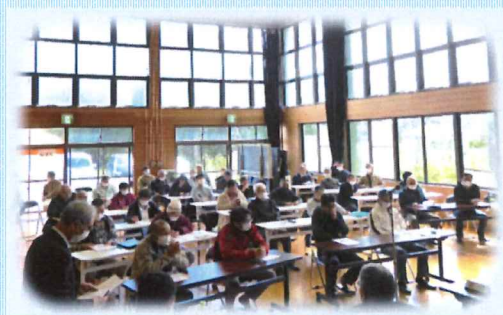
昨年の総会の様子

〔期日〕 4月18日(日) 〔時間〕 午後2時から 〔場所〕 黒岩地区交流センター 多目的ホール