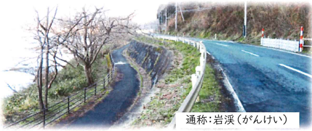
通称:岩溪(かんけい)

昨年、県へ県道(通称岩溪)の歩道設置の要望書を提出した結果、4月28日に県南広域振興局土木部北上土木センターより歩道整備事業が採択された旨の説明が、黒岩自治振興会・立花自治振興協議会にありました。