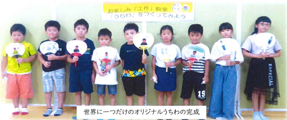
世界に一つだけのオリジナルうちわの完成