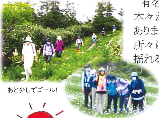
あと少してゴール!

有名な鏡沼(ドラゴンアイ)は、残雪はなく湖面には美しい緑の木々が映りこんでいました。頂上には、景色を見渡せる展望台もありましたが、曇り空で景色は残念ながら見れませんでした。所々に可憐に咲くミヤマキンポウゲやミヤマスマレ、湿原で風に揺れるワタスゲに癒されました。