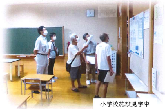
小学校施設見学中

7月21日(水)黒岩コンパクトシティ構想協議会 企画・事業部合同会議、学校施設内見学を黒岩小学校で行いました。市内での新型コロナウイルス感染者増加に伴い、意見交換や協議などはできませんでしたが、改めて協議の経過報告や今後の計画についての確認と小学校校内を見学し、実際の建物の様子や間取りを見ることでどのように活用できるか、具体的に考えるよい機会となりました。