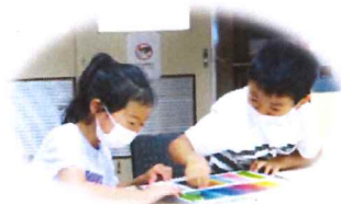
何色に しようかなあ〜