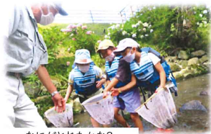
なにがとれたかな?

7月29日(木)2・4年生の児童7名が親水公園お滝さんで「水辺の生き物しらべ」を行いました。お滝さんを通る川へ入り、石を動かしながら手にした網にザリガニやどじょう、サワガニなど捕まえると歓声が上がっていました。