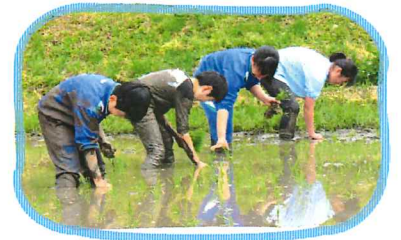
おいしいお米に育ってね!

5月22日(月)に黒岩地区の東桜小児童13名が参加し、お仕事体験学習として田植えを体験しました。