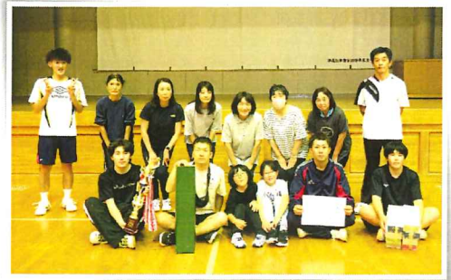
[優勝した4班のみなさん]

10月1日(日)、黒岩地区バドミントン大会が東陵中学校体育館で行われ、白熱した試合が繰り広げられました。優勝した4班の皆さん、おめでとうございます。