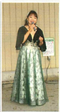
観音めぐみ歌謡ショー