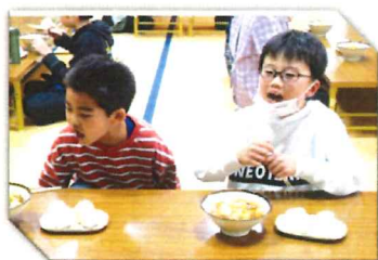
大きな声でいただきまーす!

新米の塩むすびと豚汁をお腹いっぱいいただきました。最後に黒岩地区農地・水・環境活動組織委員長より、参加児童へ新米のお土産もいただきました。