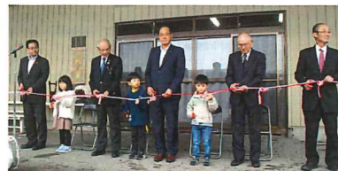
オープニングセレモニー～テープカット～

芸能公演は、黒岩の芸能「黒岩太神楽・めでた舞」「黒岩太鼓」「黒岩鬼剣舞」が出演し、観音めぐみ歌謡ショーや呉馬根公民館・東公民館の皆さんによるお楽しみステージが披露されました。また特別公演として、大槌町の吉里吉里大神楽保存会による「吉里吉里大神楽」が披露され、たくさんの方々にもまつりを盛り上げていただきました。