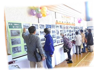
前回の黒岩地区文化祭の様子

令和6年度黒岩地区文化祭を開催いたします。 開催にあたり、皆さまからの手芸・陶芸・絵画・写真・書道など多数の作品を募集いたします。