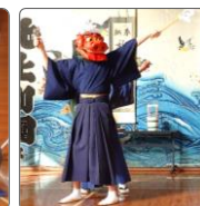
伊勢流黒岩太神楽