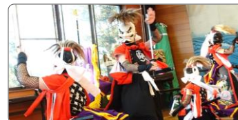
黒岩鬼剣舞 修行生