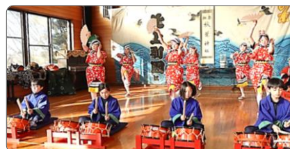
伊勢流黒岩太神楽 めてた舞